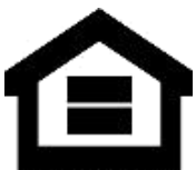
EQUAL HOUSING OPPORTUNITY

The Section 8 Housing Choice Voucher Program provides rental assistance to individuals and families who meet eligibility guidelines by paying a portion of rent directly to landlords. Applying does not guarantee a place on the Section 8 Waiting List. Applying early does not increase your chances. A random lottery will decide which applicants are placed on the Section 8 Waiting List.